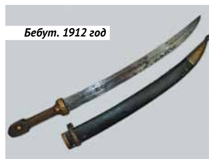
Бebut. 1912 год

Но на самом ли деле все так плохо? Конечно же, нет. Сегодня существует и развивается гильдия мастеров-оружейников современности, авторские