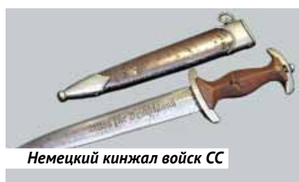
Немецкий кинжал войск СС

Если же взять современные военные конфликты, то мы увидим, что использование холодного оружия и сведено практически к нулю.