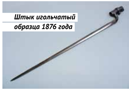
Штык игольчатый образца 1876 года