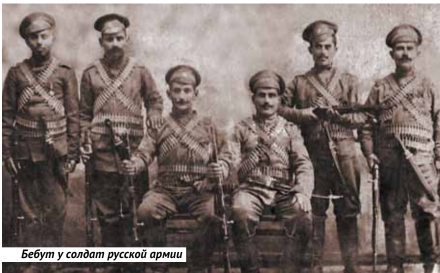
Бebut у солдат русской армии

Сегодня существует и развивается гильдия мастеров-оружейников современности, авторские работы которой широко представлены на оружейных выставках